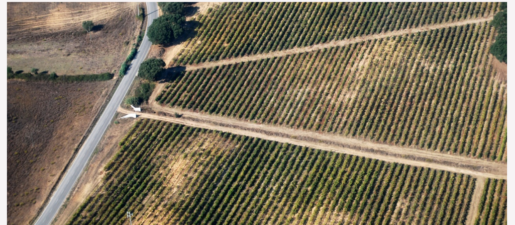
Territorio bisagra: mercado metropolitano, suelo productivo y plataformas logísticas